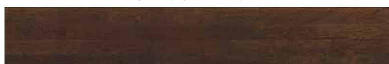
ESNF-DW <ディープウォールナット>