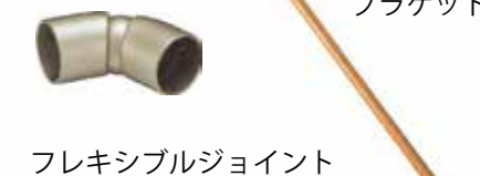
フレキシブルジョイント