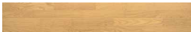
ESNF-LN <ネイキッドライト>