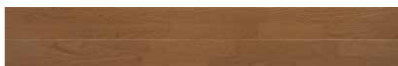
ESNF-BM <オーガニックブラウン>